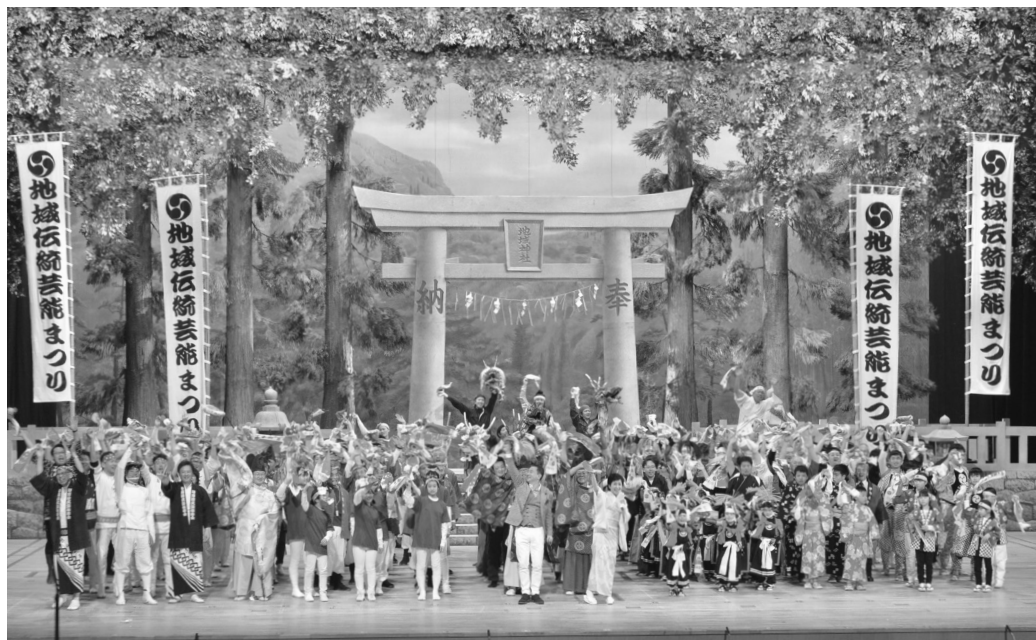
平成29年度 第18回地域伝統芸能まつり フィナーレの様子

地域創造では、地域の重要な資源である地域伝統芸能の保存・継承・活用を支援しています。なかでも、日本各地域の伝統芸能と古典芸能がNHKホールに一堂に会し、個性豊かでさまざまな芸能が歴史的・地域的な解説とともに披露される「地域伝統芸能まつり」は、日本の芸能の素晴らしさや地域の伝統の重みを再認識する機会として高く評価されています。