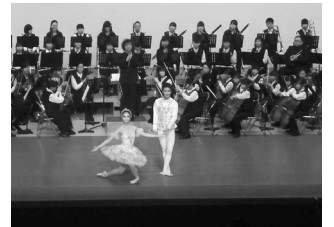
『くるみ割り人形』プレ演奏会(2018年3月)