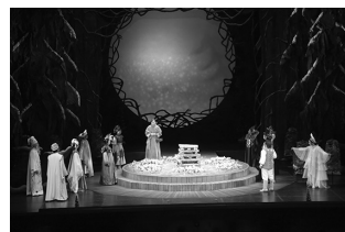
『森は生きている』2012年公演