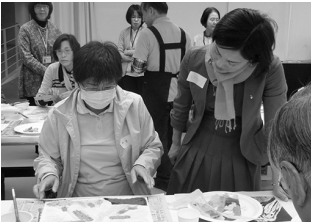
上: 展示の様子/下: 「アトリップ対話型アート鑑賞プログラム」ワークショップの様子

● 碧南市制70周年記念事業 開館10周年記念 愉しきかな! 人生—老当益壮(老いてますます盛ん)の画人たち 【会期】2018年10月30日～12月16日 【主催】碧南市藤井達吉現代美術館、碧南市、碧南市教育委員会 【出展作家】富岡鉄斎、熊谷守一、奥村土牛、中川一政、猪熊弦一郎、杉本健吉、片岡球子、秋野不矩、笈忠治、郷倉和子、岩崎巴人、大森運夫、堀文子、野見山暁治 【関連企画】記念対談: 近況を語る(11月18日)、美術館講談「ほっとけ心のアップレ介護」(11月10日)、アトリップ対話型アート鑑賞プログラム(11月21日)