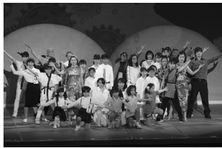
前回の公演『Xmasに想像したこと～遠い遠いいつかの私～』(2017年12月)