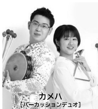
カメハ [パーカッションデュオ]