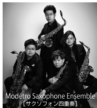
Modétro Saxophone Ensemble [サクソフォン四重奏]